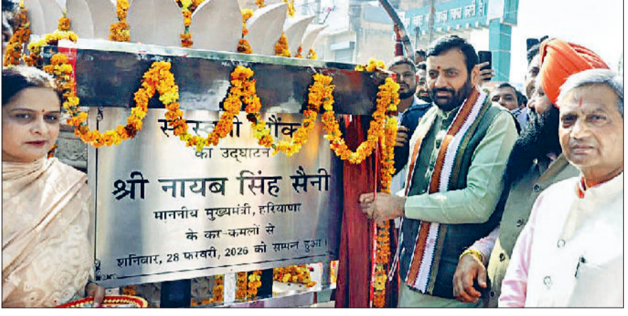
बाबैन में बनाए गए सरस्वती चौक के सौंदर्यीकरण का उद्घाटन करते मुख्यमंत्री नायब सिंह सैनी।

थे। मुख्यमंत्री ने बाबैन में बनाए गए सरस्वती चौक के सौंदर्यीकरण का उद्घाटन किया। बाबैन पहुंचने पर मुख्यमंत्री नायब सिंह सैनी का पुष्प वर्षा कर स्वागत किया गया। इस दौरान मुख्यमंत्री ने बाबैन के नागरिकों की समस्याओं को सुना और उन समस्याओं के समाधान के लिए अधिकारियों को दिशा निर्देश भी दिए। उन्होंने कहा कि सरस्वती चौक को 28 लाख रुपए की लागत से तैयार किया गया है। इस चौक को 12 फीट लंबा, 7 फीट चौड़ा और 11 फीट ऊंचाई के साथ तैयार किया गया है। इस चौक को बनाने में प्रीमियम थोलपुर बेज सैंडस्टोन पत्थर का उपयोग किया गया है।