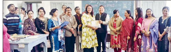
अंबाला। विजेताओं को सम्मानित करते हुए शिक्षक।