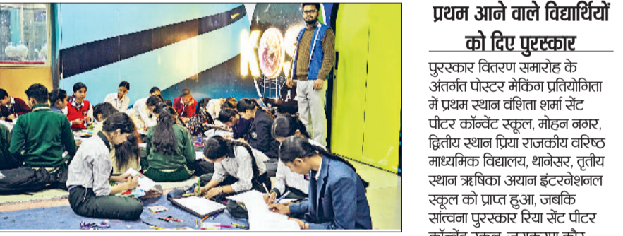
प्रथम आने वाले विद्यार्थियों को दिए पुरस्कार